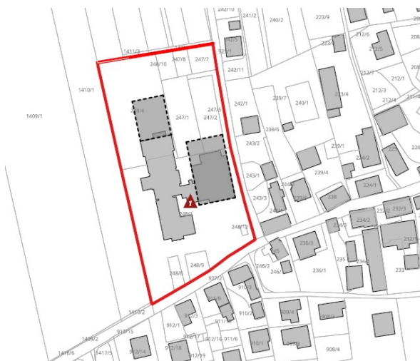
Izsek iz DPP.